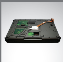
PCI/PCI-Express 3.0 扩展槽