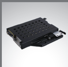
多媒体扩展仓 第 2 个存储装置