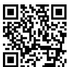
ZX80 3D demo