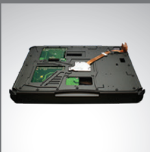
PCI/PCI-Express 3.0 扩展槽