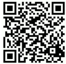
B360 3D demo